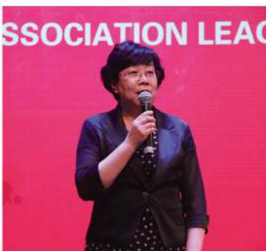
天津市副市长曹小红女士在欢迎晚宴上致辞