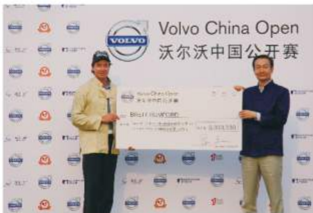
沃尔沃中国公开赛冠军奖金达333万人民币