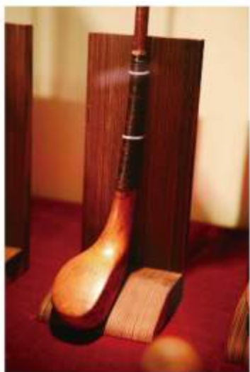
这是现存最久的长鼻子球杆之一，1860年由麦克伊万制造