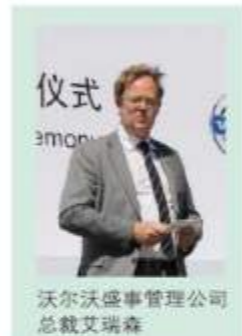
沃尔沃盛事管理公司总裁艾瑞森

去年4月，在市政府、中高协、市体育局、市高协以及社会各界的大力支持下，第18届沃尔沃中国公开赛在天津滨海湖球会取得了圆满的成功。沃尔沃中国公开赛的举办使广大天津市民感受到了高尔夫的魅力，从而推动了高尔夫运动在天津的发展，同时也让世界进一步了解了天津，让天津进一步走向了世界。