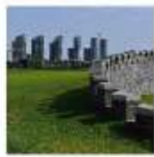
天津星耀五洲运动俱乐部 http://weibo.com/sysportsclub

中国男子职业球员, 中国男子职业锦标赛、中国男子职业挑战赛现役全卡球员, 美国PGA CLASS-A级职业教练。