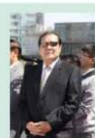
天津市原副市长、天津市高尔夫球协会主席王述祖

去年4月，在市政府、中高协、市体育局、市高协以及社会各界的大力支持下，第18届沃尔沃中国公开赛在天津滨海湖球会取得了圆满的成功。沃尔沃中国公开赛的举办使广大天津市民感受到了高尔夫的魅力，从而推动了高尔夫运动在天津的发展，同时也让世界进一步了解了天津，让天津进一步走向了世界。