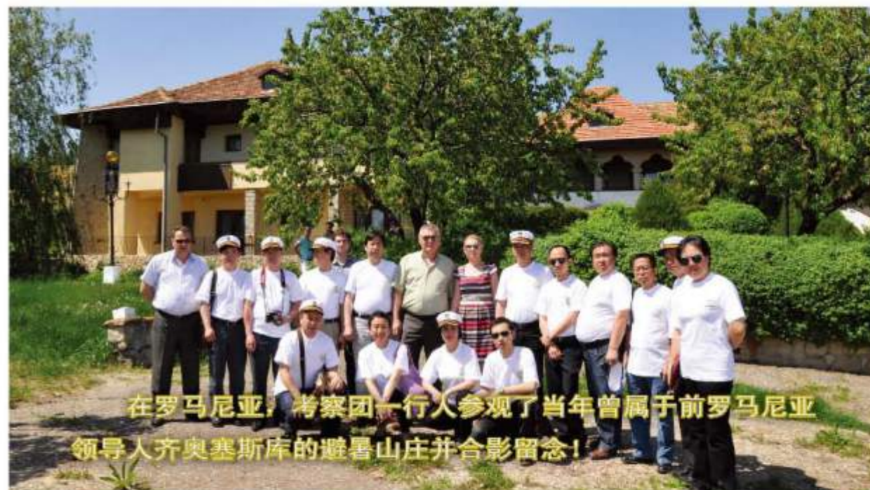
在罗马尼亚，考察团一行人参观了当年曾属于前罗马尼亚领导人齐奥塞斯库的避暑山庄并合影留念！