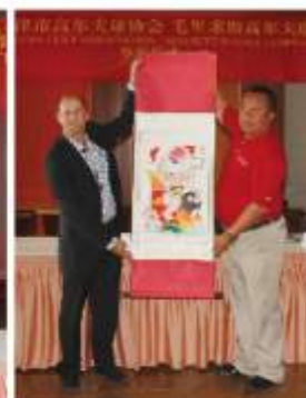
天津签约球场向毛里求斯康斯丹海岛酒店集团赠送天津杨柳青年画